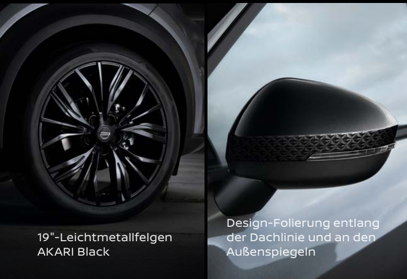
19"-Leichtmetallfelgen AKARI Black

Das ausdrucksstarke dunkle Profil des Nissan Juke Enigma verstärkt das ikonische Design des Coupé-Crossovers mit einer exklusiven Design-Folierung entlang der Dachlinie und an den Außenspiegeln. Ganz in Schwarz gehaltene 19"-Leichtmetallfelgen runden das Styling ab, wenn Sie nach Einbruch der Dunkelheit die Stadt erobern.