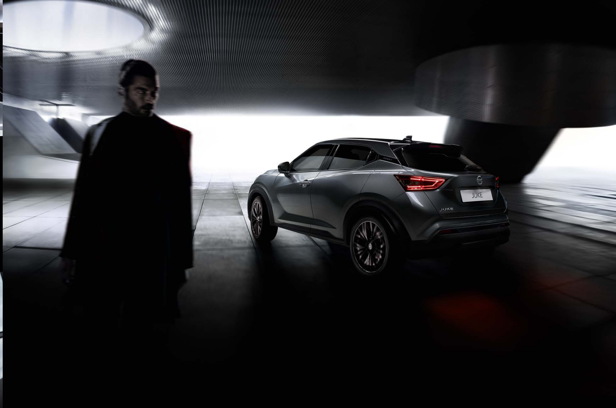
Design-Folierung entlang der Dachlinie und an den Außenspiegeln